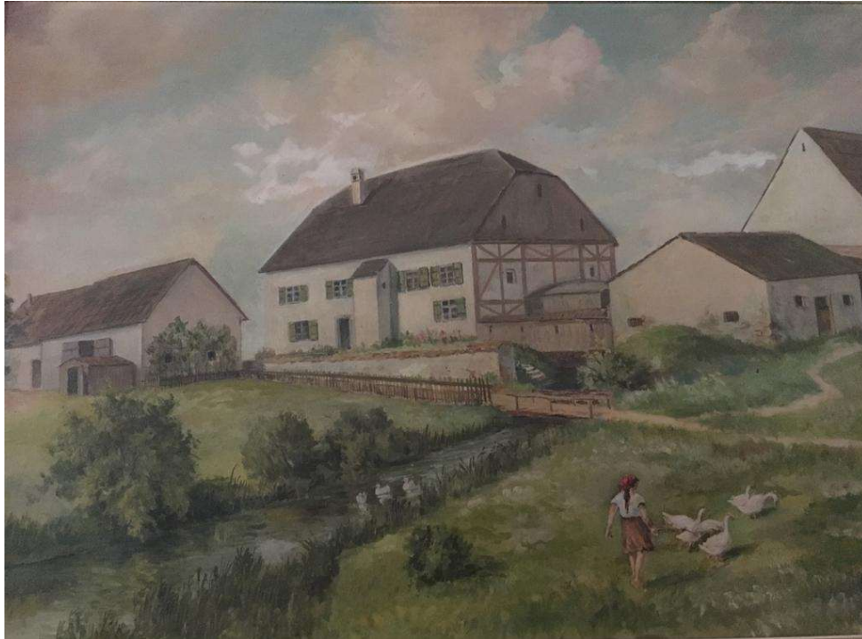
Die Untere Mühle auf einem alten Gemälde