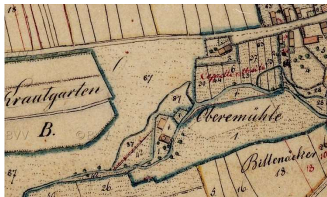
(Uraufnahme 1808 – 1864)