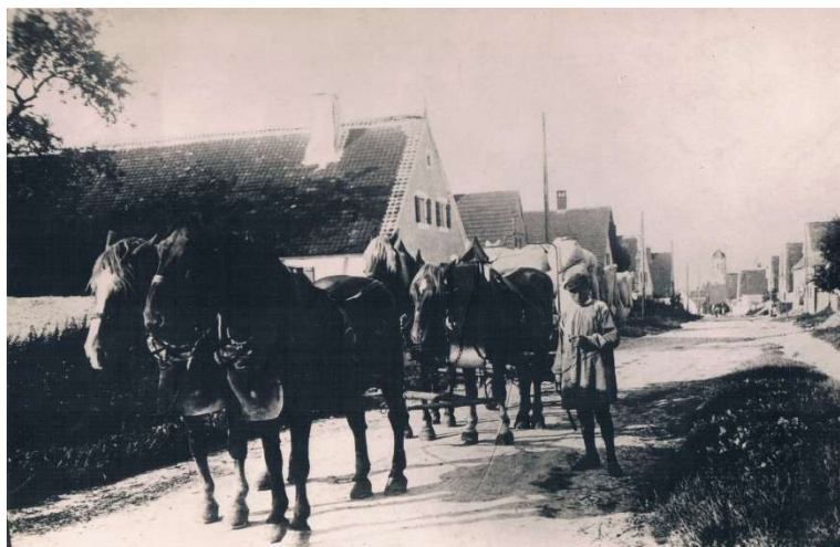
Mühlwagen der Unteren Mühle in der Dorfstraße in Appethofen