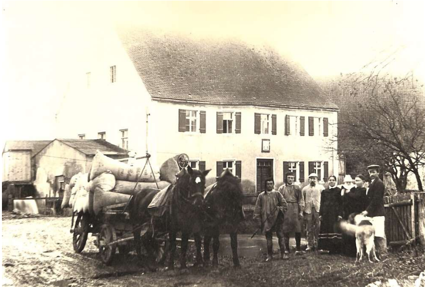
Mittelmühle mit dem Mühlwagen vor der Ausfahrt