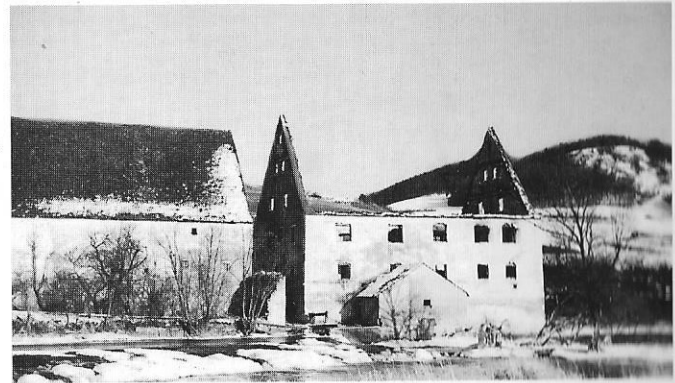
Die Tiefenmühle vor und nach dem Brand, 1940