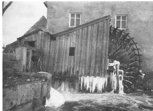
Das Mühlrad bei der Ziegelmühle

Bilder entnommen dem Löpsingen-Buch von 2013