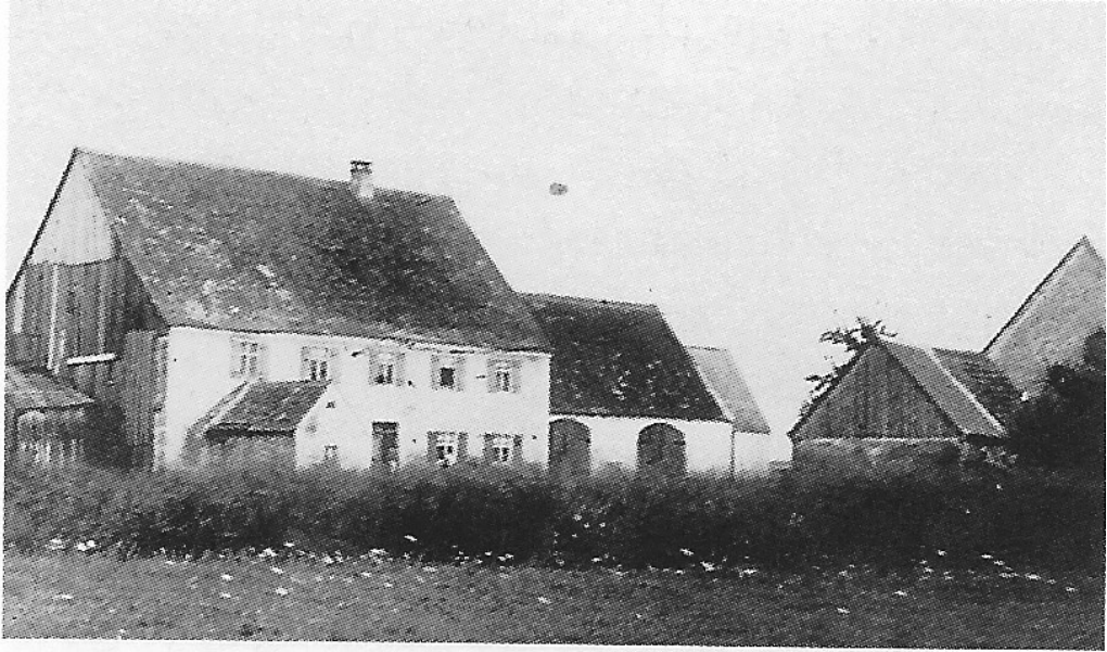
Die Ziegelmühle auf einer alten Aufnahme